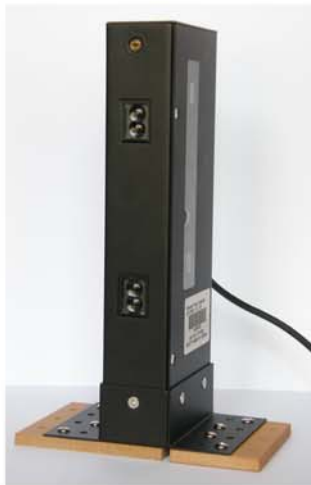
Izgled sa prednje strane