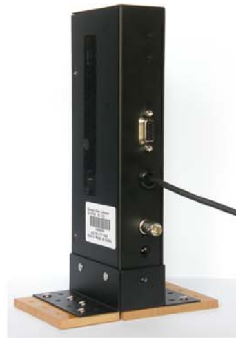
Izgled sa zadnje strane